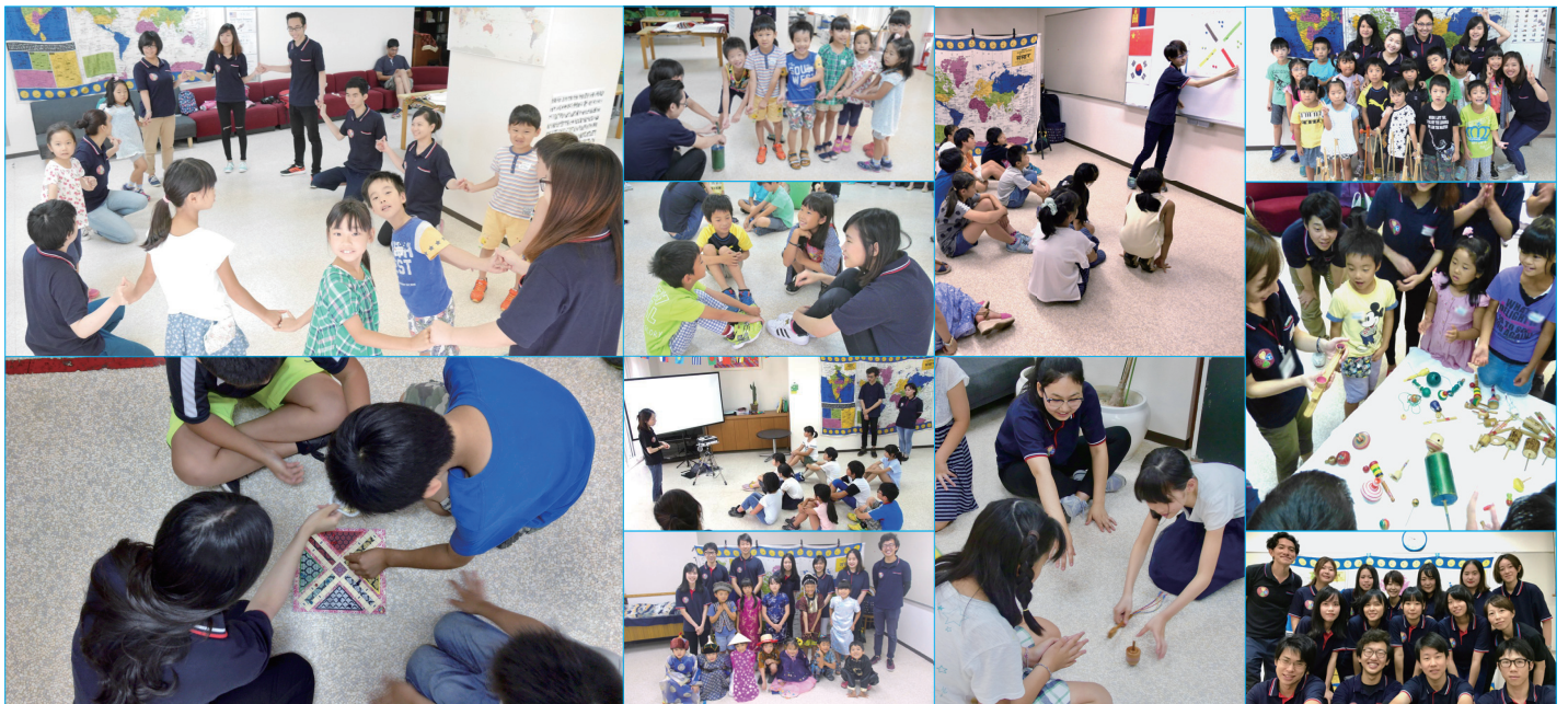
今までの「世界の学校」の様子 (2015年～2017年)

いろいろな国のお姉さんやお兄さんと 世界中のめずらしい「モノ」をつかった 遊びやものづくりに挑戦しよう！